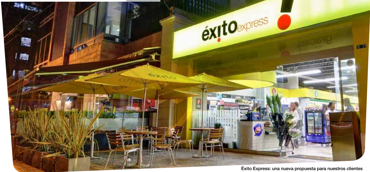
Éxito Express: una nueva propuesta para nuestros clientes