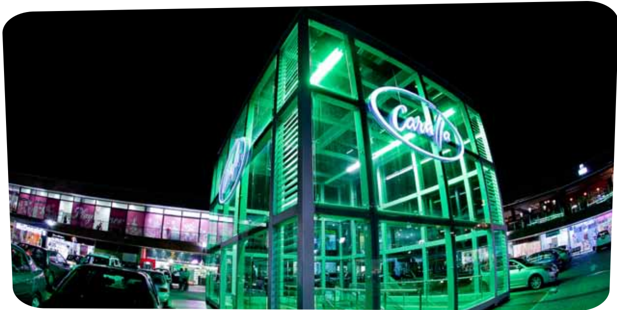
Carulla celebró 105 años. En la foto, Carulla la Visitación, Medellín.